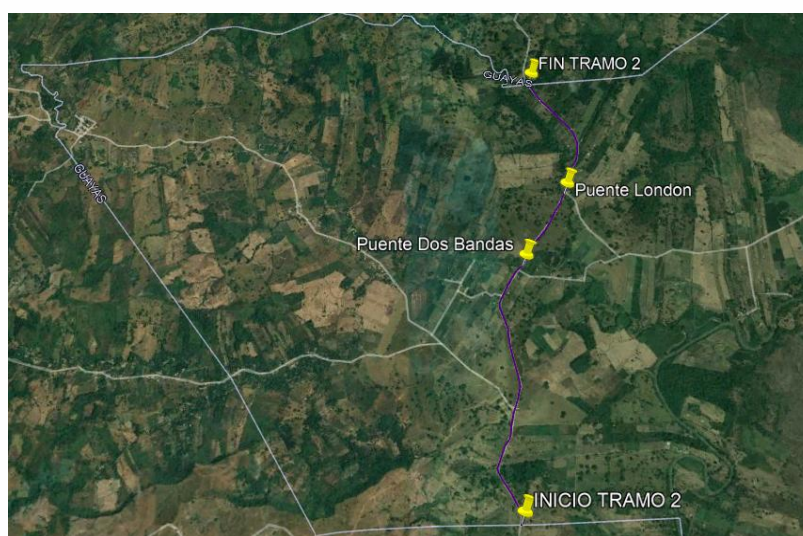
Figura 2.- Ubicación de la vía tramo 2 (Limite Provincial – Las Muras – Limite Provincial).

La señalización horizontal y vertical para la circulación vehicular y peatonal será debidamente instalada con el fin de garantizar condiciones óptimas de seguridad vial, fluidez, orden y confort en el tránsito, actualmente la vía no cuenta con ningún tipo de señalización. En este contexto, la señalización vial cumple un rol esencial al proporcionar información clara y oportuna sobre las normas de circulación y los posibles riesgos en la vía. Una correcta implementación de estos elementos contribuye a un tránsito más seguro y eficiente, reduciendo riesgos para los usuarios y el entorno. En el marco del presente proyecto, se contempla la instalación integral de señalización reglamentaria, preventiva e informativa,